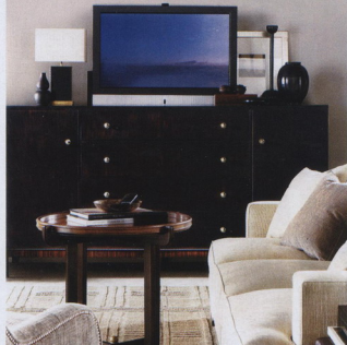
Плазменная панель BeoVision 4-65 и акустическая система BeoLab 10, Bang&Olufsen

В новой плазменной панели BeoVision 4-65 от BANG&OLUFSEN впервые реализована технология Automatic Colour Management. После каждых 100 часов просмотра изображение сканирует камера, установленная на подвижном манипуляторе. В течение нескольких секунд выполняется анализ цветовой температуры и производится её ретулировка. О внешнем виде панели и говорить нечего. Дизайнер Дэвид Льюис, как всегда, на высоте.