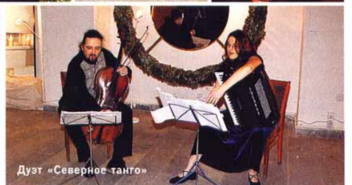
Дуэт «Северное танго»