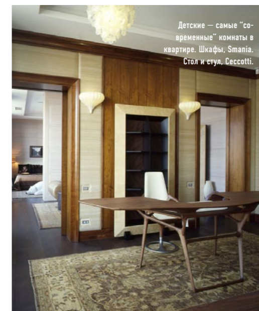
Детские — самые “современные” комнаты в квартире. Шкафы, Smapia. Стол и стул, Scaccotti.

Работы шли полтора года — что для такого масштабного проекта очень мало. Теперь хозяева потихоньку обживают квартиру — сменили, например, пару комодов. “Я не обижаюсь за свой “проектный замысел”, — смеется Нана. — Наоборот, мне приятно, когда живущие в моих интерьерах люди что-то меняют. Это значит, что они себя чувствуют уютно и свободно. А именно этого я и добиваюсь!”