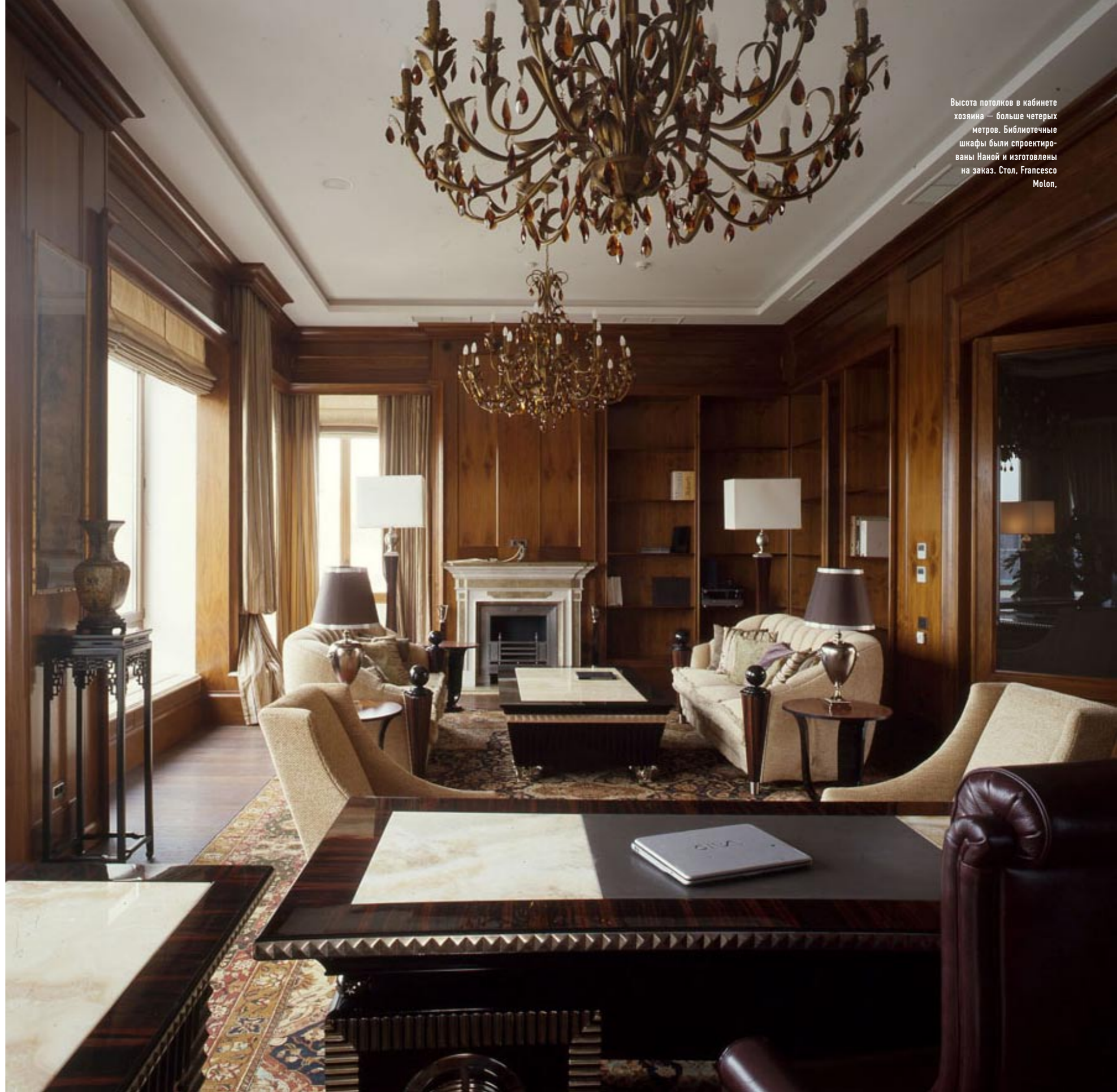
Высота потолков в кабинете хозяина — больше четырех метров. Библиотечные шкафы были спроектированы Наной и изготовлены на заказ. Стол, Francesco Molon.

Люди любят прекрасные виды и большие окна, но в данном случае именно они пред-