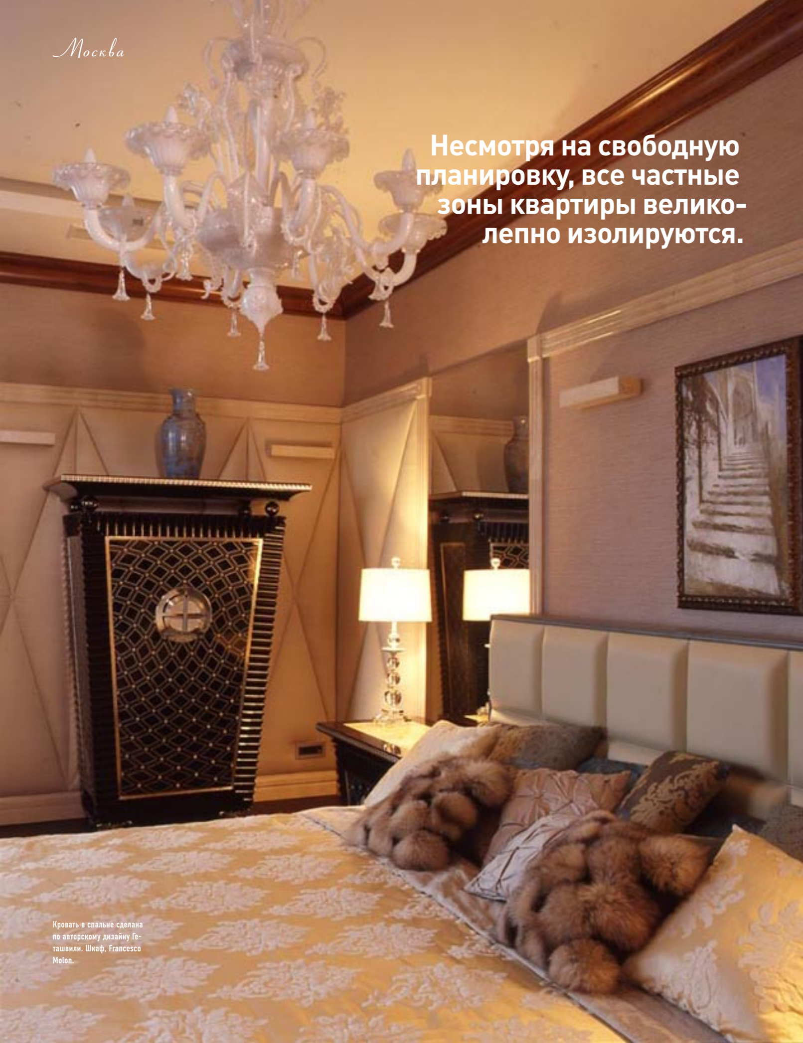
Кровать в спальне сделана по авторскому дизайну Геташвили. Шкаф, Francesco Molton.

Несмотря на свободную планировку, все частные зоны квартиры великолепно изолируются.